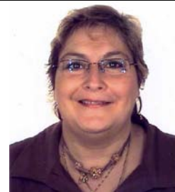
REYSEL Ch. (Div. 4D & 5A)