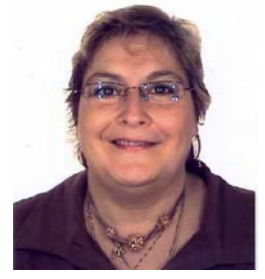
REYGEL Ch. (Div. 4D & 5A)